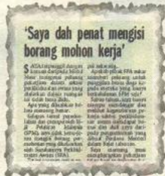
IMBAS...laporan Harian Metro, 3 Disember lalu.

Untuk makluman pengadu, urusan pengambilan bagi calon yang berdaftar dengan SPA adalah melalui persaingan terbuka (open competition) di mana calon perlu melepasi syarat lantikan sesuatu skim perkhidmatan dan tapisan tertentu yang ditetapkan SPA. Contohnya, seperti pe-