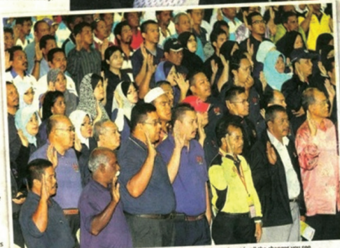
Civil servants are the backbone of Government programmes. They play an integral part in all the changes you see.

so far in the Government Transformation Programme are by themselves, an obvious statement of their commitment and passion over this mission.