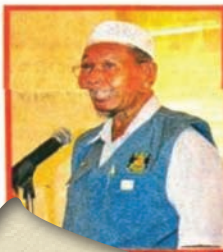
一名退休的公僕，他希望聯邦公共服務局能將退休公僕事務如退休金、伸至東馬，這樣退休公僕不必飛往布城處理退休事務。

“目前我最想看到的是公务员不是单一民族的专利，而是希望各民族都对公务员一职有兴趣，在政府部门里有各民族、各肤色的公务员，大家才能活出一个马来西亚的精神，同时才能有效解决各民族的生活问题，因为来自不同族群的公务员会了解各自族群的利益及提供方便。”