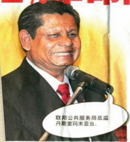
聯邦公共服務局總監 丹斯里瑪末亞當。

(本报美里16日讯)联邦公共服务局总监丹斯里玛末亚当强调，职高权大并不能代表什麼，是否能获得属下及民众的尊重才重要；另外，公务员是解决问题者，而不是收集问题者。