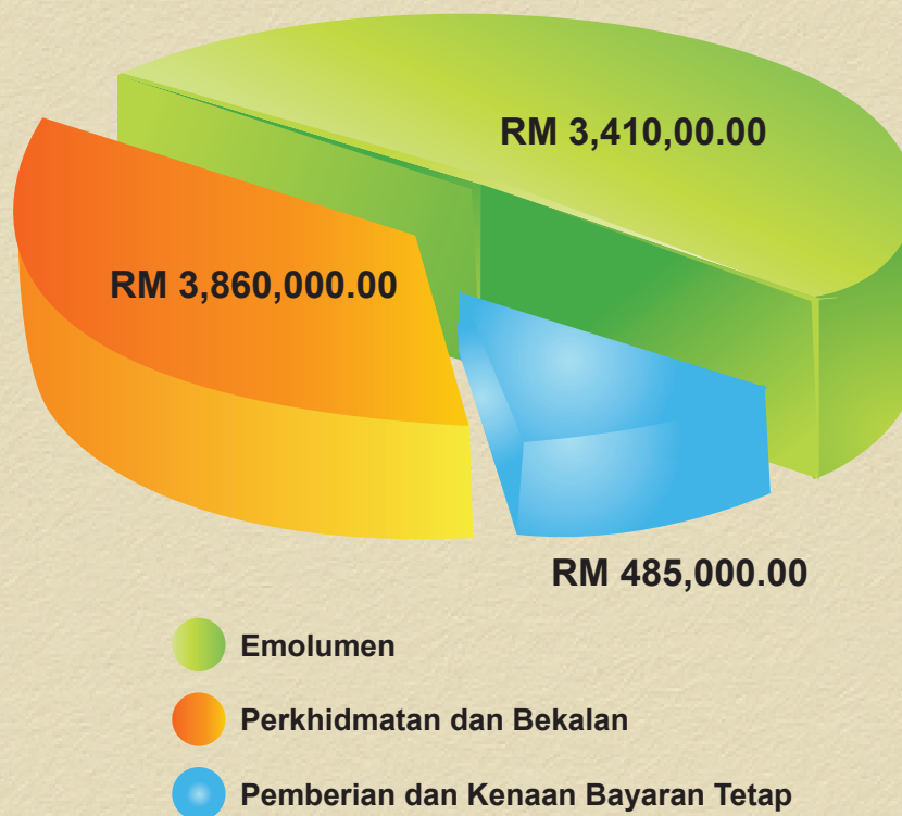
CARTA 7 PERUNTUKAN TANGGUNGAN TAHUN 2012

Di bawah Maksud Tanggungan (T09), Suruhanjaya telah diluluskan peruntukan berjumlah RM7,755,000.00. Berdasarkan peruntukan ini, sebanyak RM3,410,000.00 untuk Emolumen; RM3,860,000.00 untuk Perkhidmatan dan Bekalan dan RM485,000.00 untuk Pemberian dan Kenaan Bayaran Tetap. Peruntukan yang telah dibelanjakan sehingga tarikh akaun awam tahun 2012 ditutup ialah RM4,324,134.20 atau 55.76%. Peruntukan Tanggungan bagi tahun 2012 adalah seperti Carta 7 .