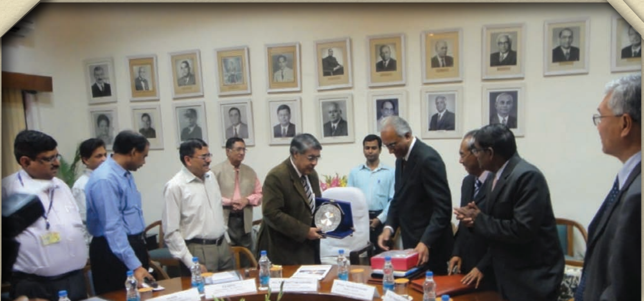
Timbalan Pengerusi SPA bersama delegasi di India

Suruhanjaya Perkhidmatan Awam Malaysia telah mengadakan lawatan kerja ke New Delhi, India pada 06 November 2012 sehingga 09 November 2012 bertujuan untuk mempelajari pelaksanaan urusan pelantikan ke dalam perkhidmatan awam serta urusan perkhidmatan/tatatertib yang diamalkan oleh Union Public Service Commission (UPSC), Staff Selection Commission (SSC) dan Department Of Personnel & Training (DOPT) di New Delhi. Delegasi lawatan ini telah diketuai oleh Timbalan Pengerusi SPA, YBhg. Dato' R. Segarajah, serta disertai oleh dua orang Ahli Suruhanjaya dan dua pegawai SPA.