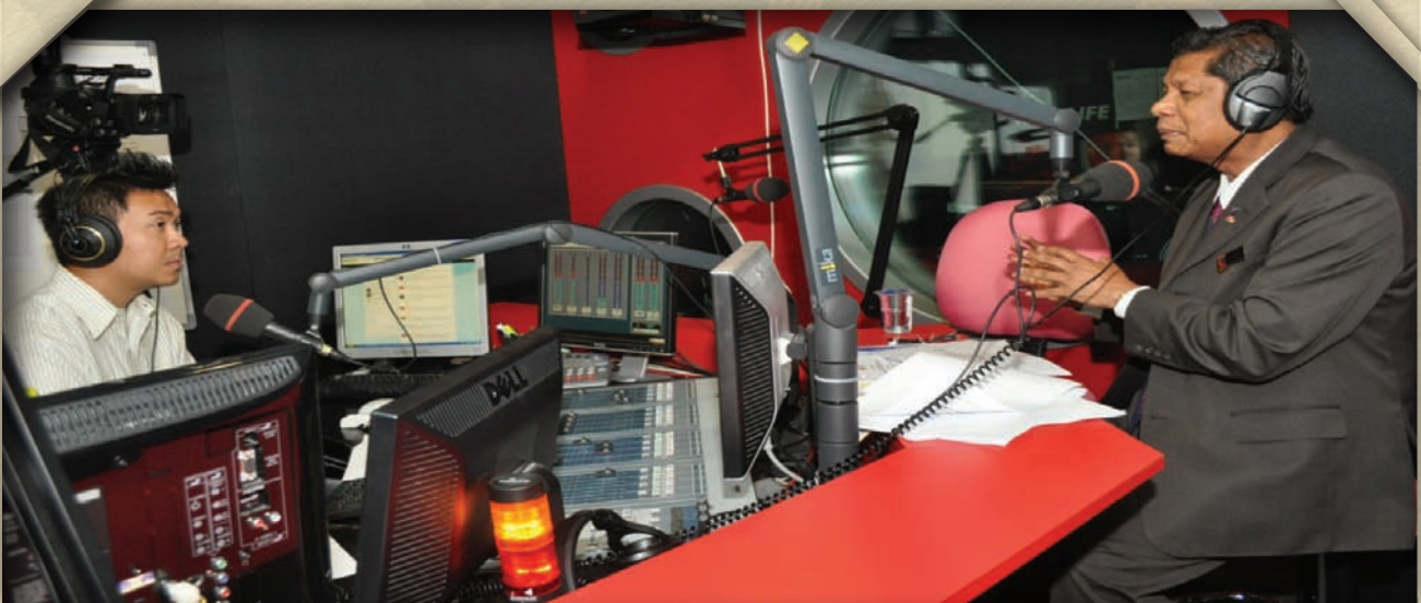
Temu bual dalam rancangan Bual Bicara Bernama Radio24 di Wisma Bernama