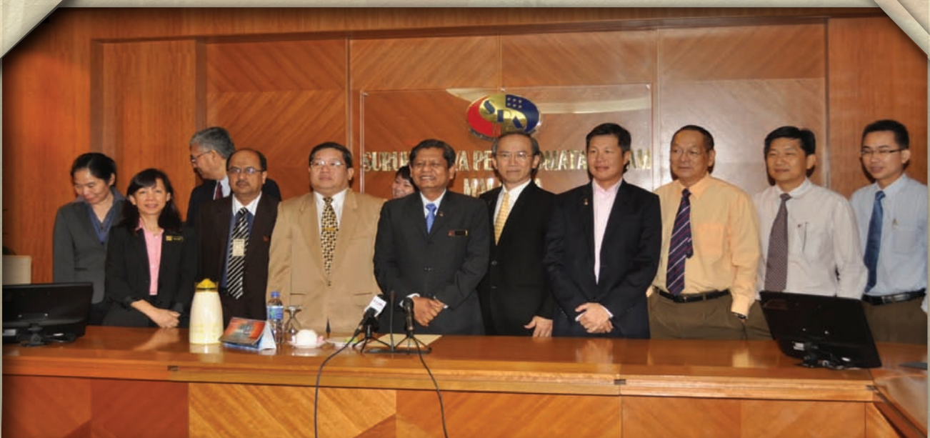
Pengerusi SPA bersama Pertubuhan Gabungan Cina Malaysia (Hua Zong)